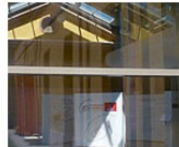
Reggio Studienreise Info