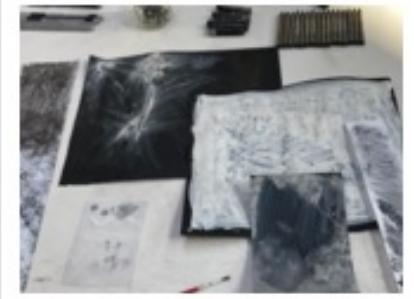
Diplom Reggio DESIGN Pädagogik