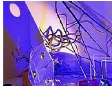
Reggio Atelier Professionllehrgang