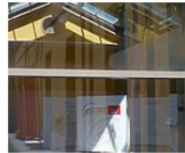
Reggio Studienreise Info