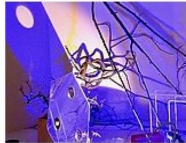
Reggio Atelier Professionallehrgang